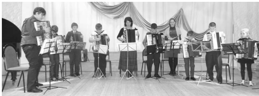
Оркестр баянов и аккордеонов ДШИ.