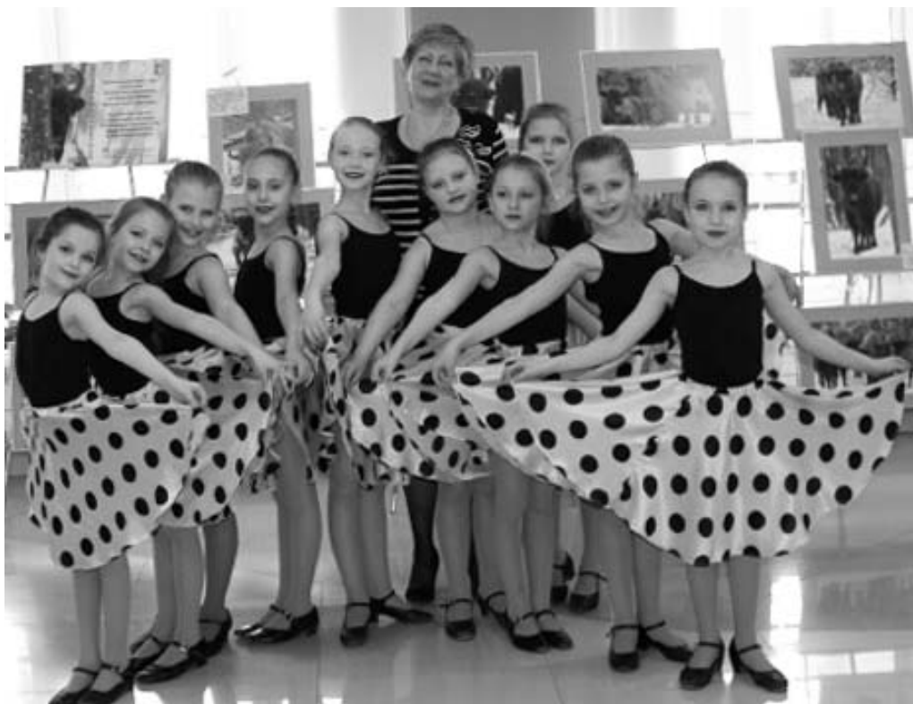
Юные танцоры на конкурсе в городе Сосенском.