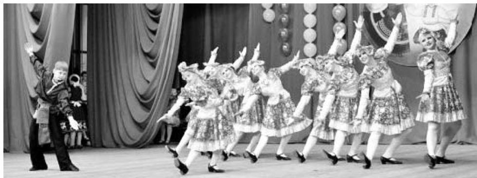
Конкурс «Песоченские забавы».